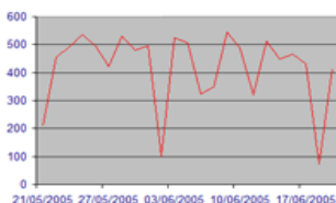
Activités des appels